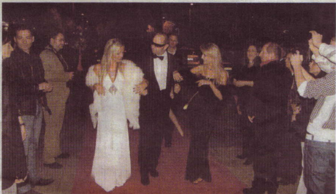
Glamouröser Auftritt ganz Hollywood-like.