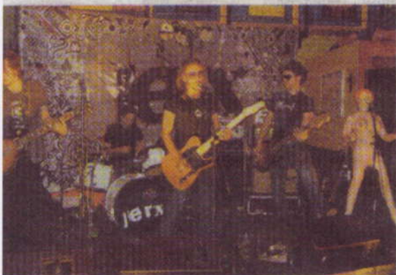
„Boner Bitch“ rockten das Dieselkino.